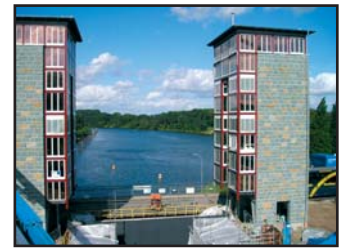
Arbeiten am Staudamm

auch zunehmend im Bereich von Kläranlagen und Staudämmen.