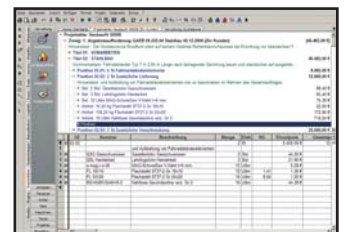
....und gleichzeitige Transparenz per Knopfdruck in der Kalkulationsansicht.